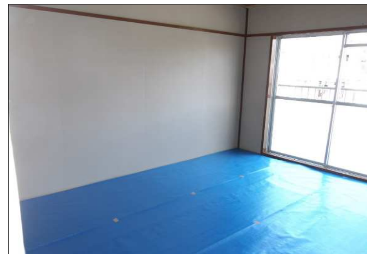
●和室（6帖） ※畳はシートで保護しています。