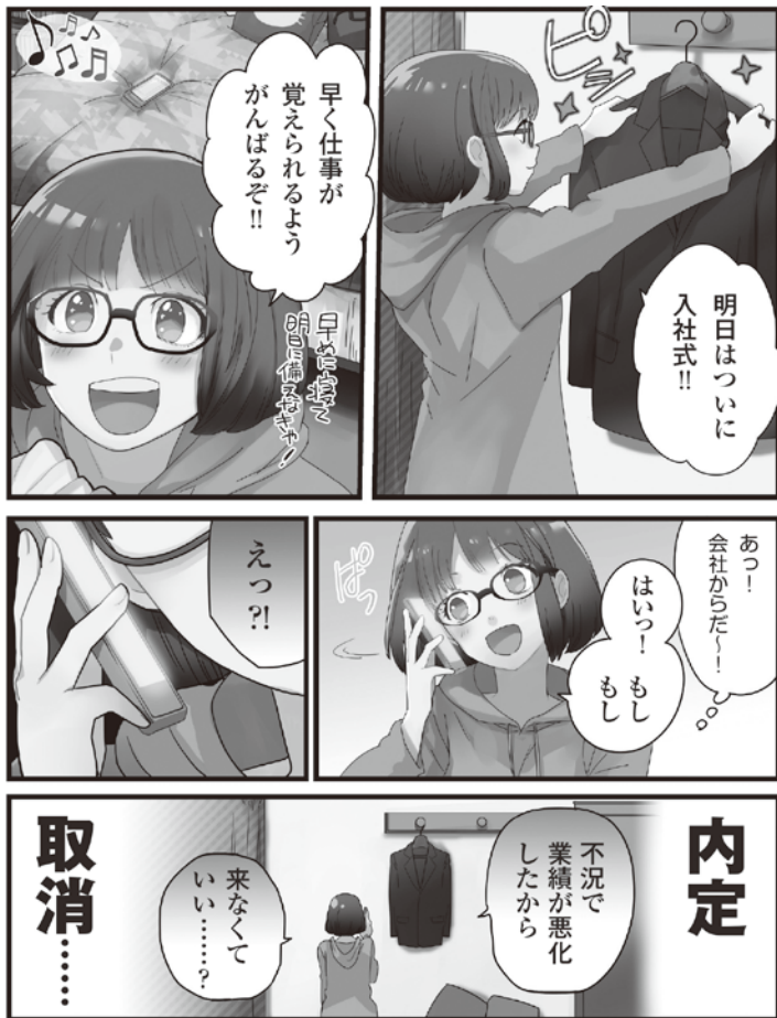
厚生労働省「これってあり?～まんが知って役立つ労働法Q&A」