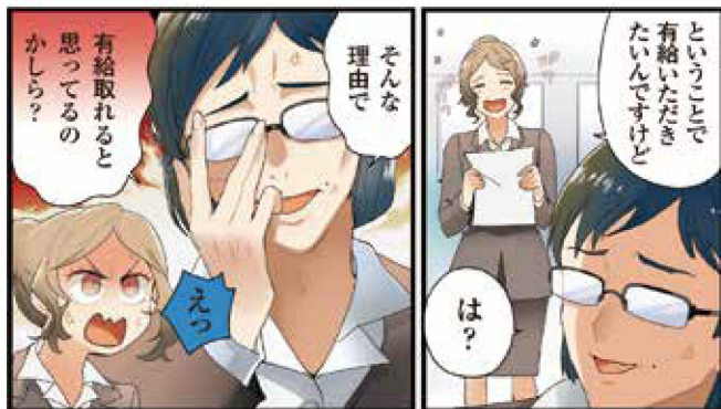
厚生労働省「これってあり?～まんが知って役立つ労働法Q&A」

則、労働者が請求する時季に与えることとされています。休暇をとる理由や利用目的によって却下されることはありません。