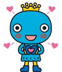
西宮市観光キャラクター みやたん