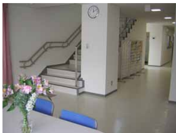
ミーティングスペース