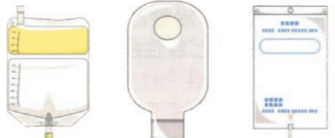
栄養剤バッグ ストーマ袋 CAPDバッグ