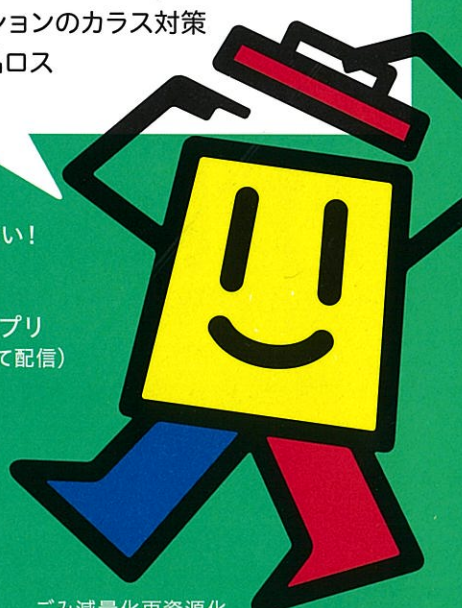
ごみ減量化再資源化 シンボルキャラクター「りーくるくん」