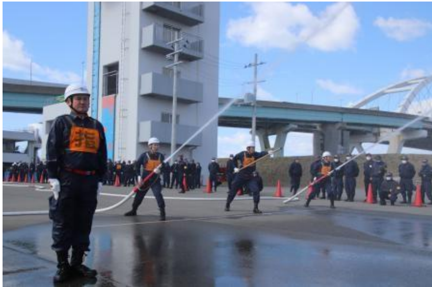
消防団消防操法大会