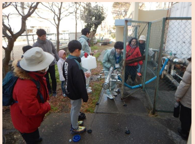
応急給水コーナー（受水槽）