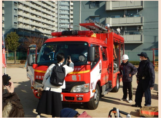
消防車両展示コーナー