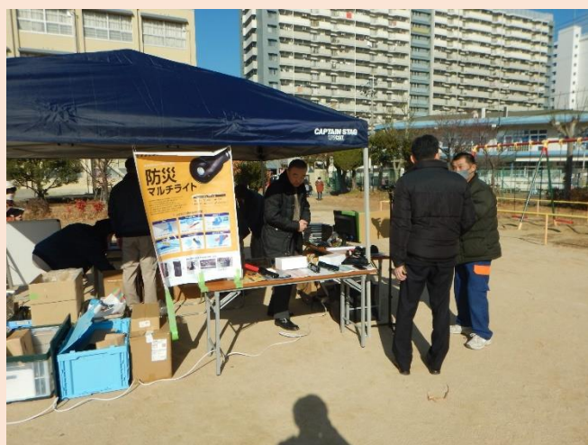
防災マルチライト実演