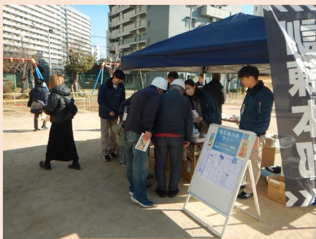
防災グッズ配布（訓練本部）