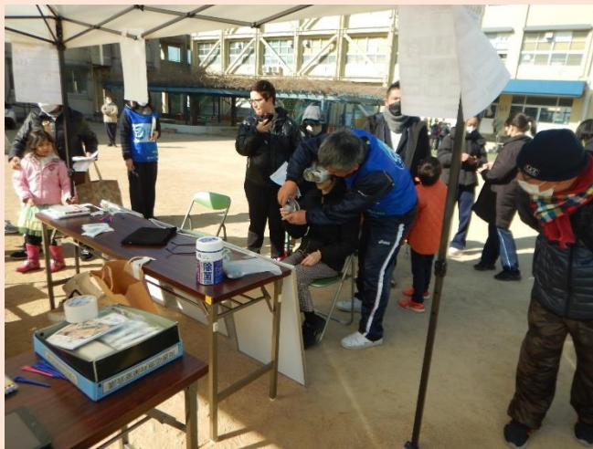
災害VR体験コーナー