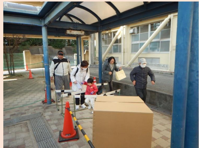
避難シミュレーションゲーム