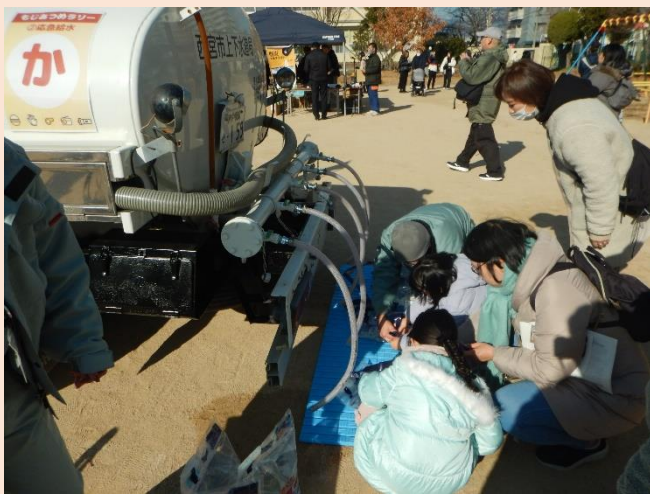
応急給水コーナー（給水車）