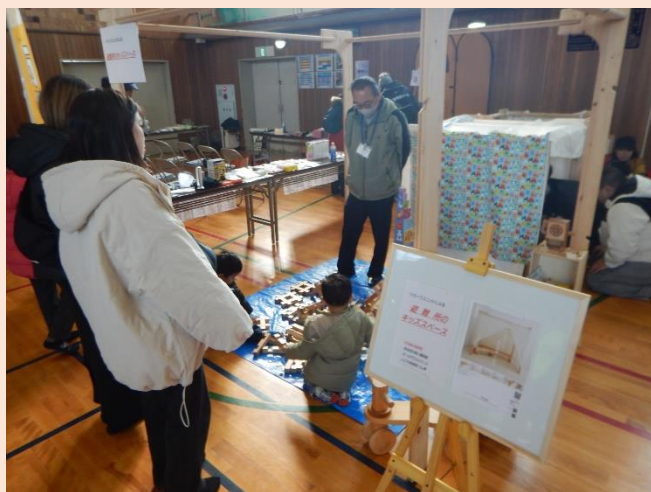
避難所キッズスペース