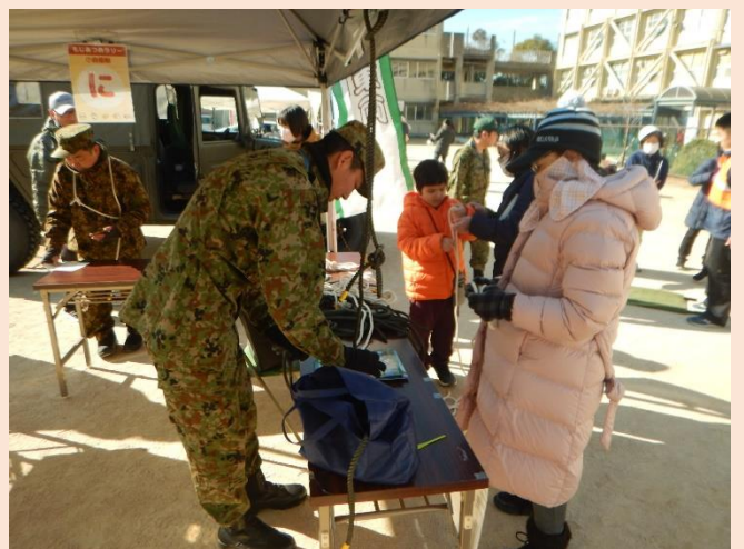
ロープワーク体験