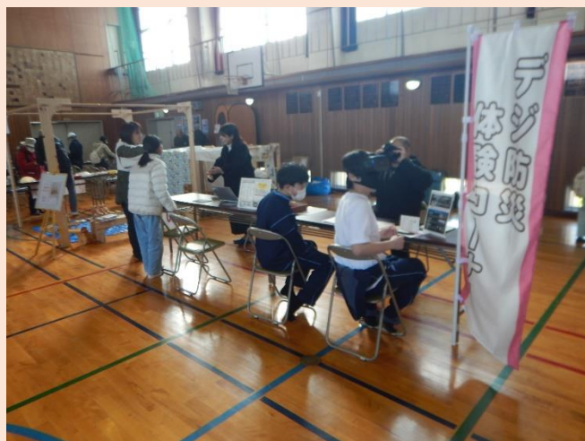
デジタル防災体験