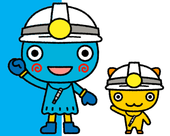
西宮市キャラクター みやたん みやこ

『地域避難支援制度』とは、一人では移動が難しかったり、情報を得ることが難しかったりする災害時に手助けが必要な人を、自治会など身近な地域で支えやすくする仕組みのことです。