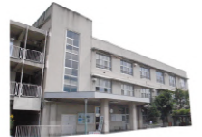
総合教育センター / 築 78 年