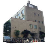
江上庁舎 / 築 47 年