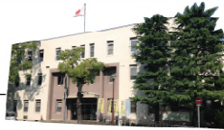
教育委員会 / 築 64 年