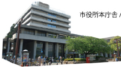
市役所本庁舎 / 築 45 年