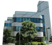
上下水道局 / 築 28 年