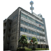
消防局 / 築 20 年