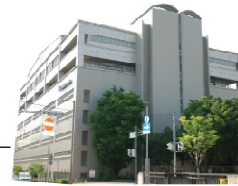
東館 / 築 19 年