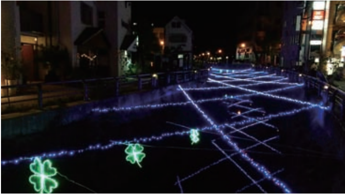
津門川のイルミネーション(南昭和町)

もともとは、幼稚園の子供たちや地域の有志によって川掃除が行われてきました。そこに商店街が加わり「津門川の自然を守る