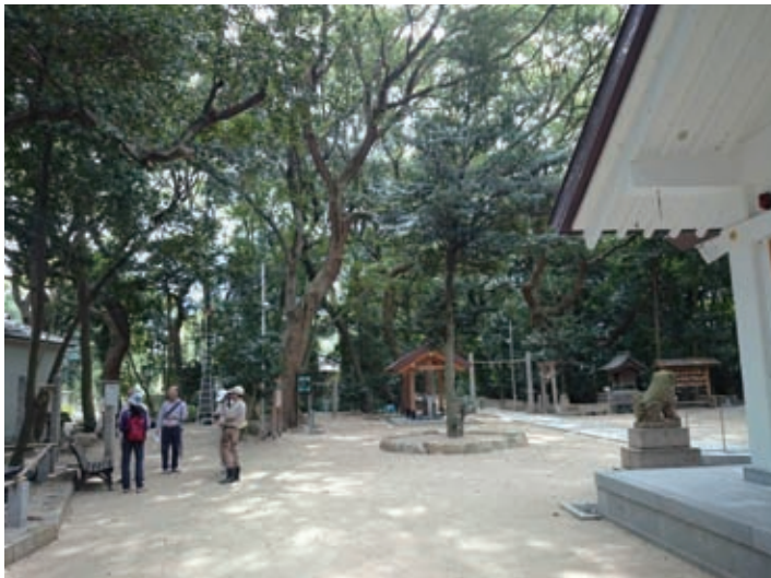
「夏の掃除は、蚊が多くて大変です」

風の強い日や雨の降ったあとは枯れ枝が落ちることが多いので「注意 木の枝落下」という、心のこもった手作りの立札が所々に立てられています。