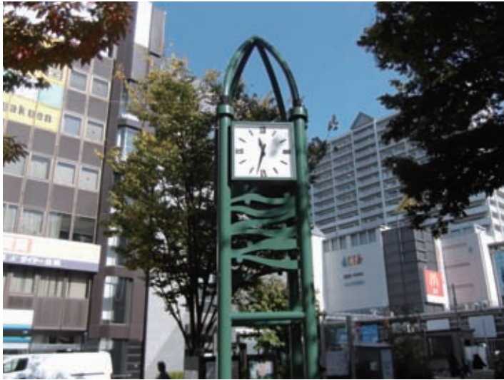
にしきた公園の時計塔(甲風園1丁目)