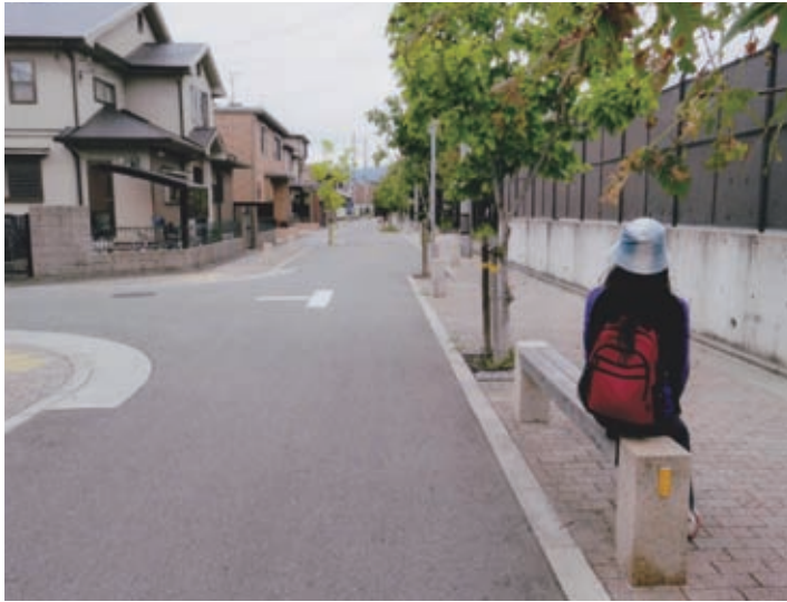
憩いのあるまちなみ(高木西町)

地域の人々の手によって再建された神社仏閣などもあり、今も残る緑あるまちなみの中で、ゆっくりとした時間が過ごせます。