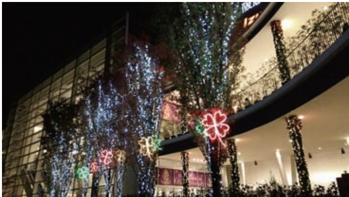
阪急西宮ガーデンズ前の四葉のクローバー

「四葉のクローバー」はこれら3つの施設と、もとよりあった北西のにしきた商店街とがつながり、地域を活性化させるシンボルマークとなっています。