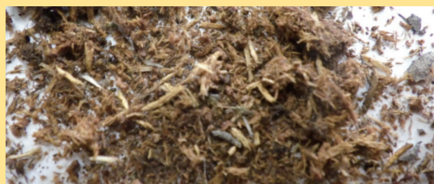
他種のフラス 繊維状の木くずが多く見られる