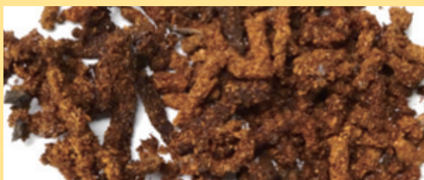
クビアカツヤカミキリのフラス 繊維状の木くずが見られない