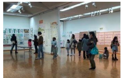
図 7-1 環境パネル展

EWC環境パネル展は、生き物、自然、資源、ごみ、身近なまちのことから平和、福祉、国際、防災、産業など、市民の持続可能な社会に向けた取り組みを発表する催しであり、平成 4 年度（1992 年度）から始まっています。小学生がEWCの活動などで地球や環境に関して取り組んだ作品の他、中学生・大人や海外からの作品を展示しています。