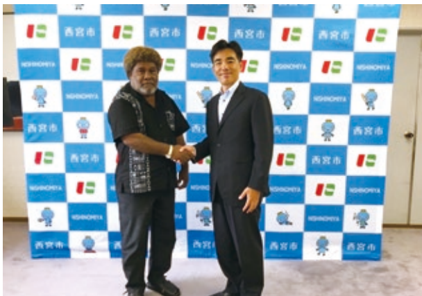
ホニアラ市との交流

・令和元年(2019年)10月に、ソロモン諸島のホニアラ市において、西宮市と同様の「環境学習都市宣言」が行われ、記念式典にあわせ、西宮市長から応援ビデオメッセージを送付しました。また、同宣言に先駆け、ホニアラ市長以下7名が西宮市に来訪した際には、本市が平成15年(2003年)に同宣言を行うに至った経緯の説明や環境関連施設の案内を行ったほか、両市が直面する環境課題に関する意見交換を行うなど、相互に交流を行いました。