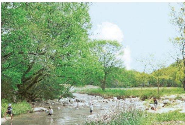
仁川自然保護地区

・歴史や文化を伝える社寺や大学、まちなかの貴重な樹林や巨木については、本市の「自然と共生するまちづくりに関する条例」に基づき、令和2年(2020年)3月現在、景観樹林保護地区(26地区、合計約16.3ha)や保護樹木(135本)を指定し、所有者と連携して保全しています。