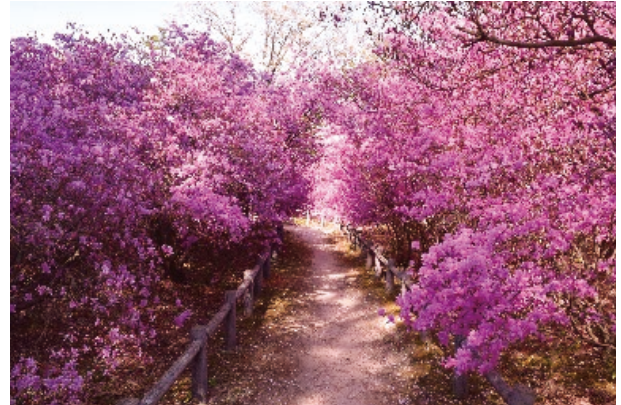
コバノミツバツツジ

ため、令和元年度(2019年度)には県指定天然記念物「越木岩神社の社叢林」の保存修理事業が完了しました。