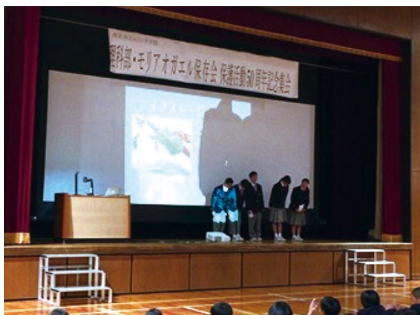
モリアオガエル保護活動 50周年記念集会

・適正飼育の指導のため、令和元年度（2019年度）には、夏休み期間に小学生とその保護者の市民を対象に「動物管理センター見学会」を行い、その中で「ふれあい教室」を実施し、命の大切さや動物についての正しい知識を学ぶ機会となりました。