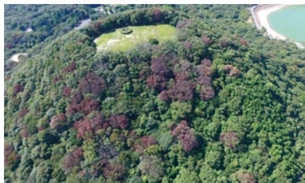
ナラ枯れ被害の様子

本市では、平成24年度（2012年度）に社家郷山キャンプ場周辺の2本のコナラで初めてナラ枯れの被害が確認されました。その後、平成28年度（2016年度）には、2,077本が確認され市内全域に被害が拡大しました。被害木については、危険木を中心に伐倒・くん蒸処理などを行っており、近年は減少傾向にあります。今後も引き続き経過観察が必要です。