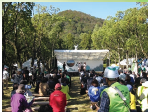
ひょうご森のまつり2019

兵庫県では、水源のかん養など多様な公益的機能を持つ森林を『県民共通の財産』と位置付け、県民総参加で森を守り、育て、広げる取り組みを行っています。それをPRする場として、毎年『ひょうご森のまつり』を県内各所において、兵庫県・開催地の市町・（公社）兵庫県緑化推進協会の共催で開催しています。令和元年度（2019年度）は、「豊かな森から川、海へとつながるめぐみ、つながるいのち」をテーマに、市内の兵庫県立甲山森林公園で開催され、約5,000人が来場し、記念式典（表彰式）、記念植樹、記念講演などが行われました。