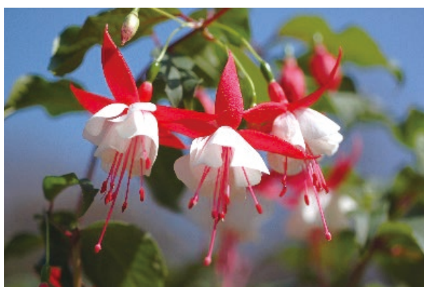
西宮市オリジナル植物(エンジェルスイヤリング)

・北山緑化植物園内にある植物生産研究センターでは、植物バイオテクノロジーを活かし、本市の環境に合った新品種「西宮市オリジナル植物」を開発・展開しています。