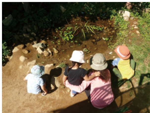
甲東北保育所のビオトープ

・ビオトープや観察池は、生き物の移動の中継地や、子どもたちが自然に触れ合える身近な場として重要な役割を果たしています。本市では、学校園や保育所でのビオトープの整備・活用を推進しており、市内の公立保育所では、在来種によるビオトープ(池)などが設置されています。