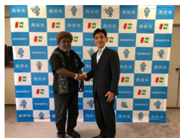
図 7-3 ホニアラ市との交流

・令和2年度（2020年度）は、新型コロナウイルス感染症拡大防止のため、海外からの視察の受け入れ等は、実施されませんでした。令和元年（2019年）には、ソロモン諸島のホニアラ市等において、西宮市と同様の「環境学習都市宣言」が行われ、記念式典にあわせ、西宮市長から応援ビデオメッセージを送付しました。また、同宣言に先駆け、ホニアラ市長以下7名が西宮市に訪れた際には、本市が平成15年（2003年）に同宣言を行うに至った経緯の説明や環境関連施設の案内を行ったほか、両市が直面する環境課題に関する意見交換を行うなど、相互に交流を行いました。