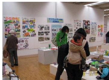
図 7-1 環境パネル展 (令和元年度実施の様子)

近年は 300 点から 900 点程の海外作品の出展がありましたが、令和 2 年度（2020 年度）は、新型コロナウイルス感染症拡大防止のため中止となりました。