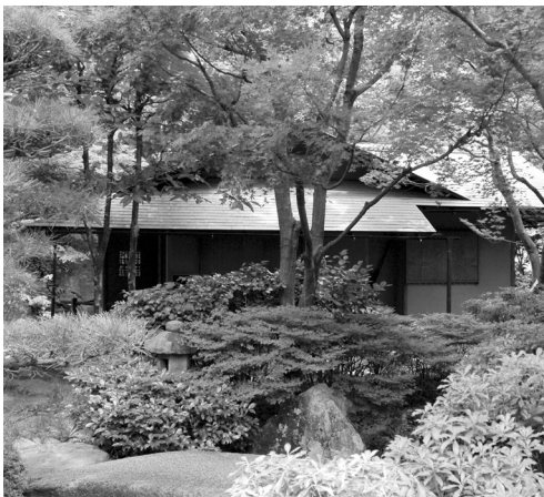
▲北山山荘茶室「不盡庵」