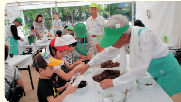
指導：西宮市花と緑のまちづくりリーダー 石巻ど根性ひまわりの会、花工房職員