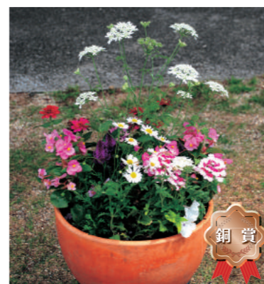
銅賞 苔楽園中学校生活文化同好会 2年