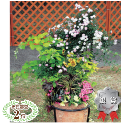
市民審査 2位 甲子園一番町グリーンクラブ 中山 明美