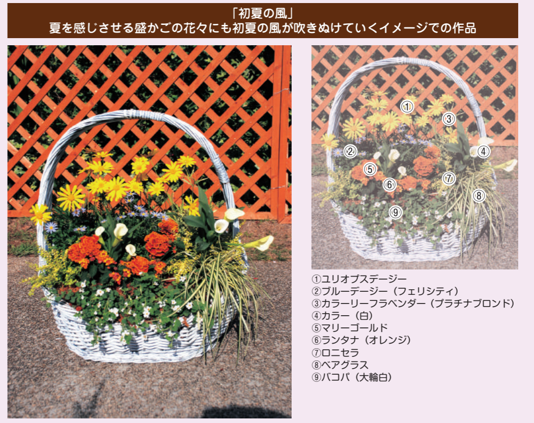
「初夏の風」 夏を感じさせる盛かごの花々にも初夏の風が吹きぬけていくイメージでの作品