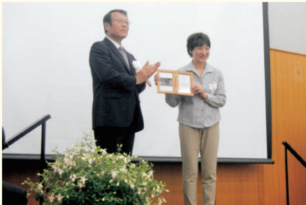
ガーデンコンペ 市長賞・銀賞 審査委員長特別賞 フレンドシップ賞受賞者への表彰