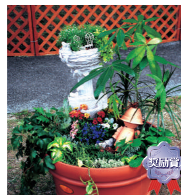
奨励賞 甲子園短期大学 B