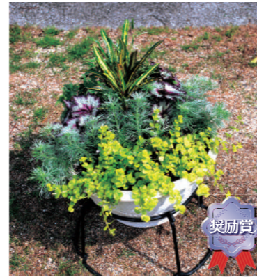
田代町自治会 篠原 伸廣