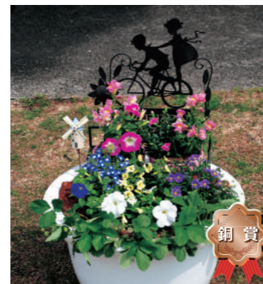
銅賞 甲子園短期大学 A