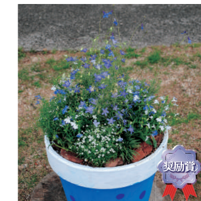
奨励賞 甲子園短期大学 A