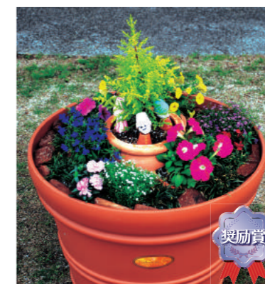
奨励賞 甲子園短期大学 B