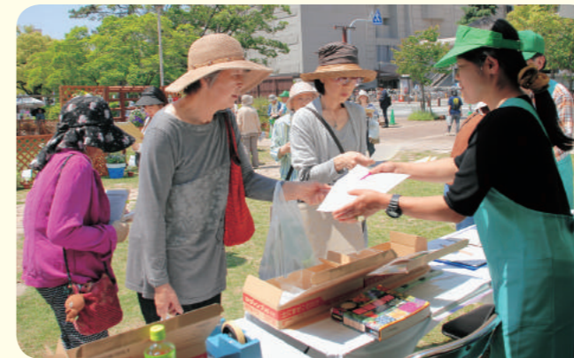
協力：西宮市花と緑のまちづくりリーダー