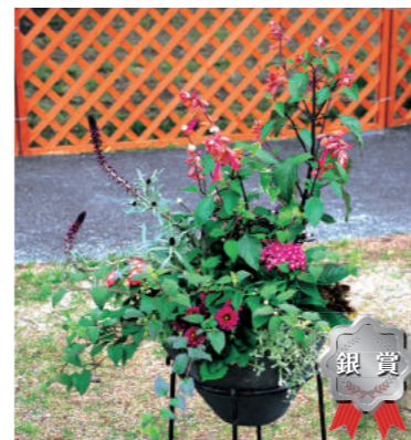
銀賞 甲子園一番町グリーンクラブ 岸 美樹