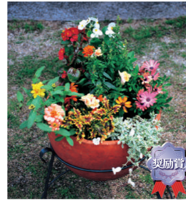
奨励賞 苔楽園中学校生活文化同好会 3年