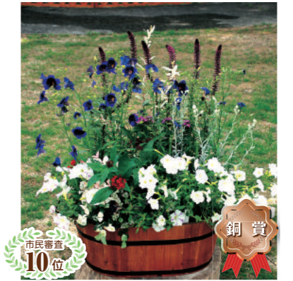
市民審査 10位 甲風園3丁目ガーデンクラブ 溝口 ひろ子