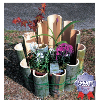
兵庫県立宝塚北高等学校 園芸部