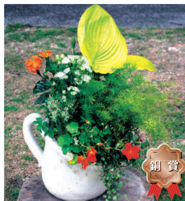
銅賞 甲子園一番町グリーンクラブ 岸 美咲帆