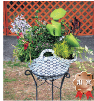
銅賞 甲子園一番町グリーンクラブ 岸 美咲帆