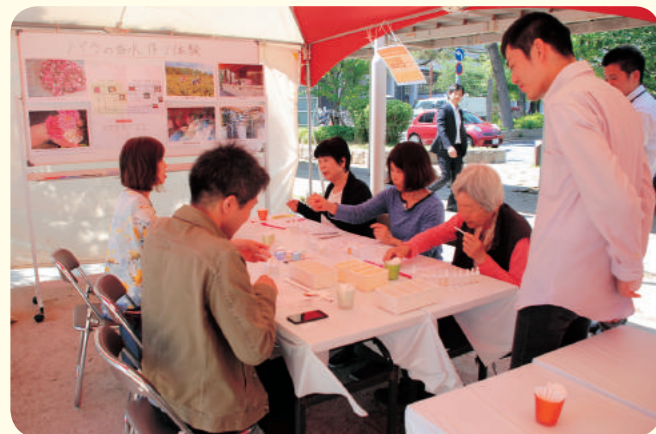
出展：LLP 日本香りデザイン協会