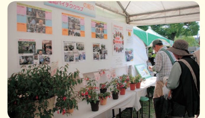
協力：ガーデンクラブ自主活動グループ きのこクラブOB会