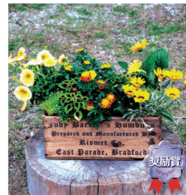
奨励賞 甲子園一番町グリーンクラブ 岸 美樹