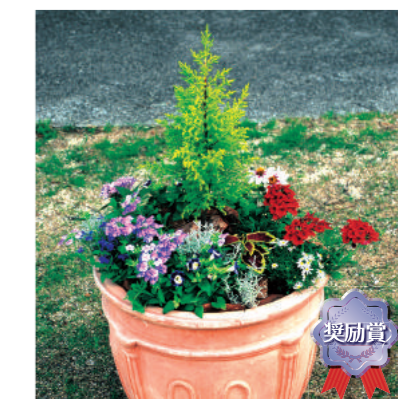
奨励賞 甲子園短期大学 C