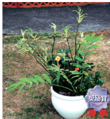
奨励賞 甲子園一番町グリーンクラブ 岸 美樹