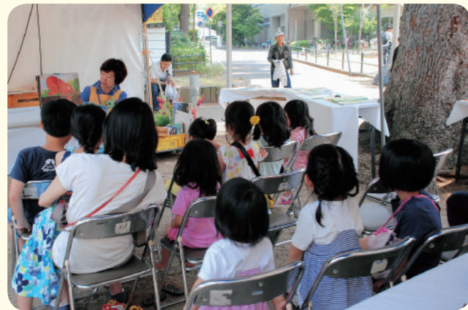
出展：市立図書館 図書館ボランティア