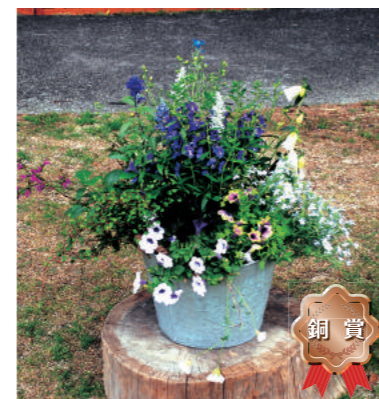
銅賞 甲子園一番町グリーンクラブ 岸 美咲帆