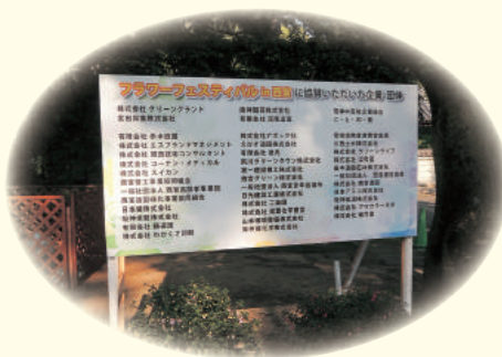
フラワーフェスティバル in 西宮に 協賛いただいた団体・企業一覧 会場掲示の様子