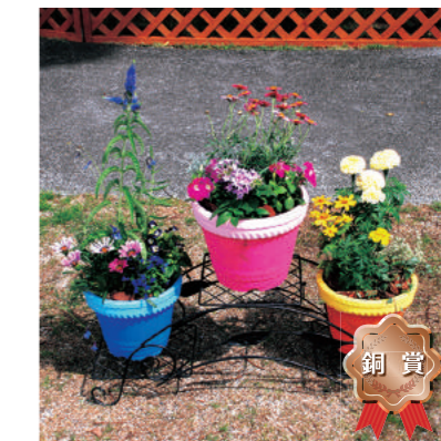
銅賞 甲子園短期大学 B