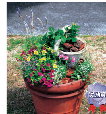
奨励賞 甲子園短期大学 A