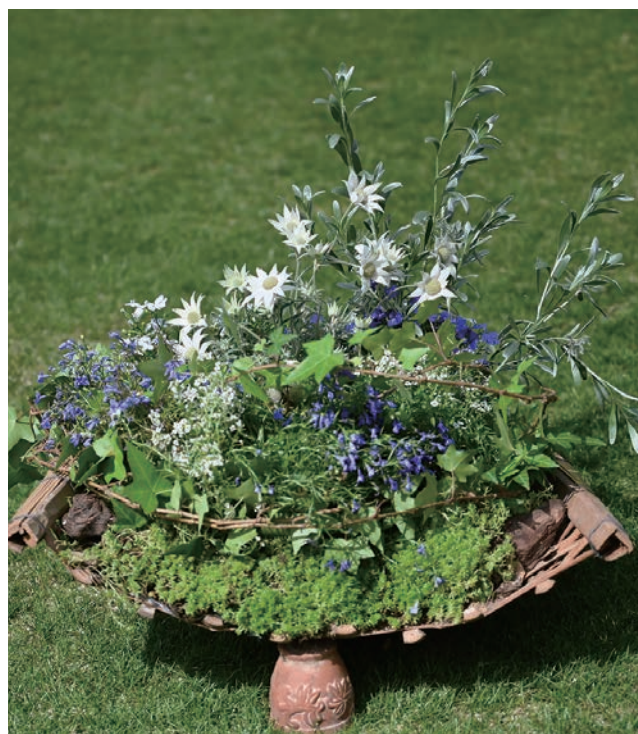
7位 北夙川小学校園芸ボランティア