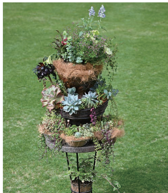
6位 成原 やよい