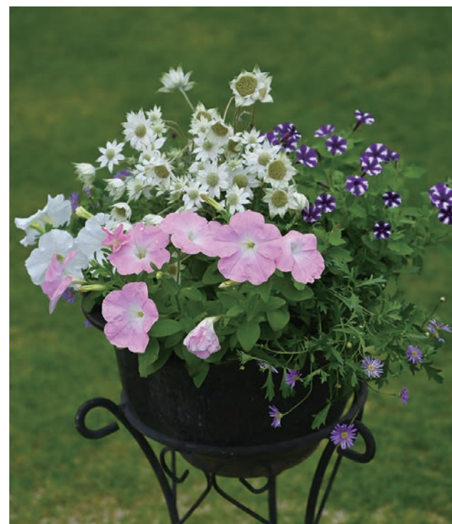
10位 甲子園一番町グリーンクラブ 池内 良子