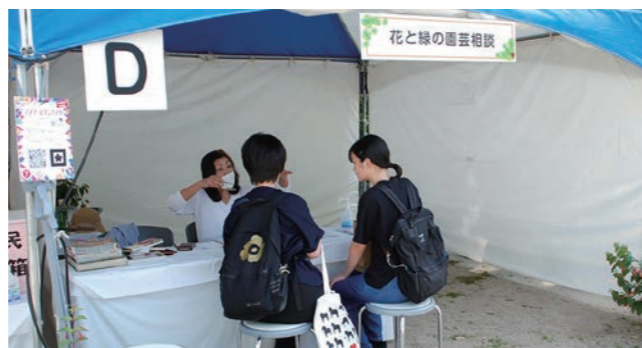
花と緑の相談会 相談員:西宮市北山緑化植物園 緑の相談員