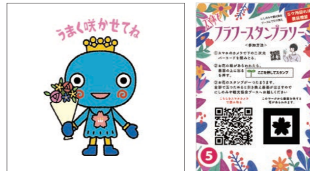
デジタルスタンプラリー 出展:にしのみや観光協会