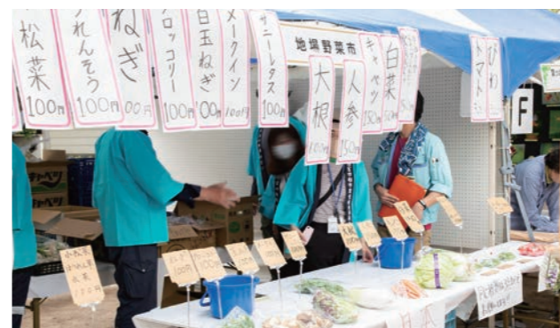
地場野菜販売会 出展:西宮市農業祭等実行委員会