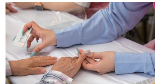
フラワーネイルアート 出展:西宮商工会議所女性会 ※収益は緑化基金に寄付されました。