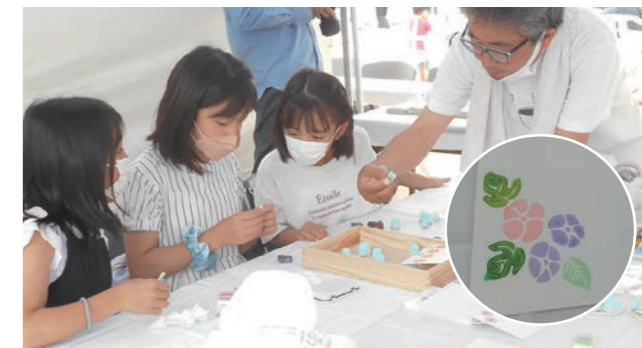
消しゴムハンコでお花のカード作り 出展:にしのみや観光協会