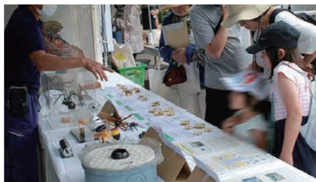
ガーデニングにひそむ虫に気をつけよう!