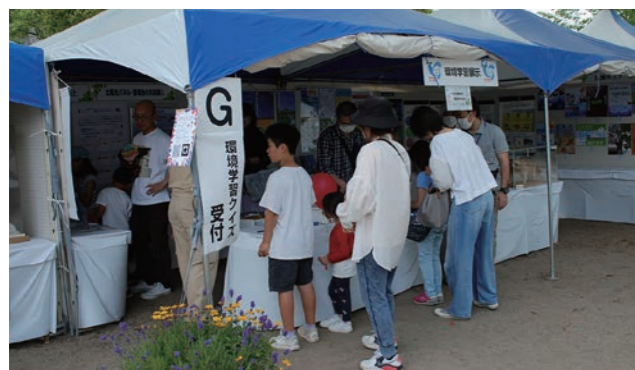
環境学習展示・環境学習クイズ 出展:西宮市環境企画課、花と緑の課