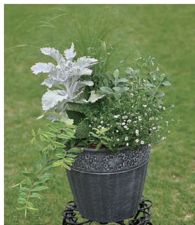
8位 八若 ゆみ