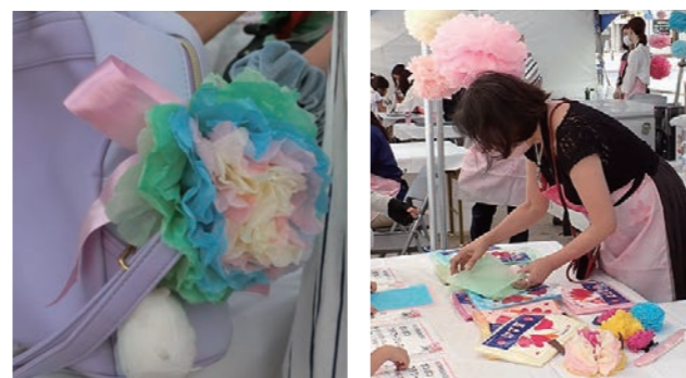
ペーパーフラワーPONPONプレスレット作成 ワンコインドリンク・一口パンの販売 出展:西宮商工会議所女性会 ※収益は緑化基金に寄付されました。