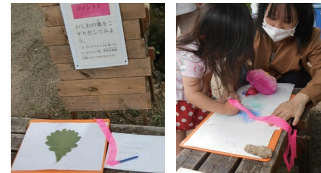
葉っぱのフロッタージュ(こすりだし)ラリー 出展:パークマネジメント鳴尾浜