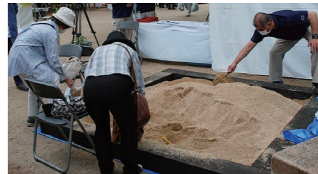
リサイクル砂の配布