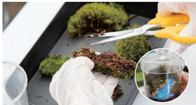
苔テラリウムをつくろう! 講師:Moss Garden 泉 大瑚氏