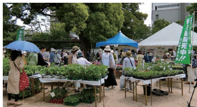
花と緑の市 運営:西宮市北山緑化植物園 市民ガーデンセンター