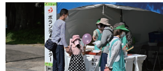
市民緑化ボランティア協力 協力:市民緑化ボランティア(はなパル・にしのみや)きのこOB会、ガーデンクラブ自主活動グループ・パイオII 本祭典、市民ボランティアの皆さまのご協力により運営されており、今年度も多くの方にご協力をいただきました。