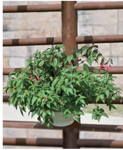
上甲子園福祉会環境衛生部