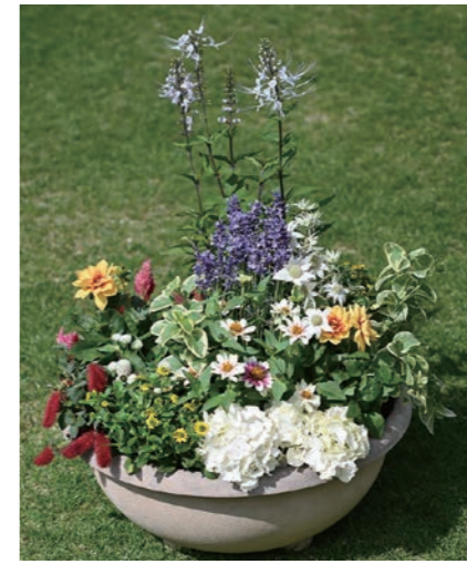
北夙川小学校園芸ボランティア