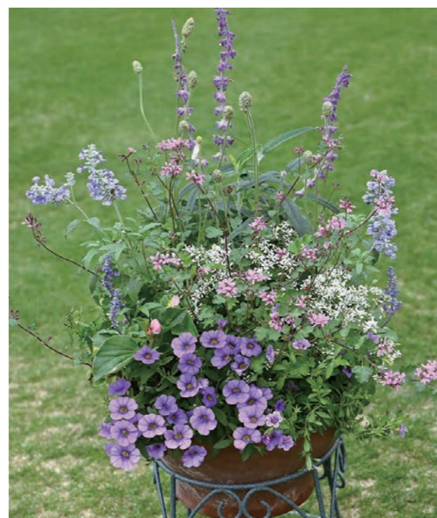
4位 甲子園一番町グリーンクラブ 中井志津子