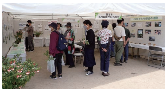
花と緑のまちづくり展示 出展:ガーデンクラブ自主活動グループ・パイオII、きのこクラブOB会、西宮市花と緑の課