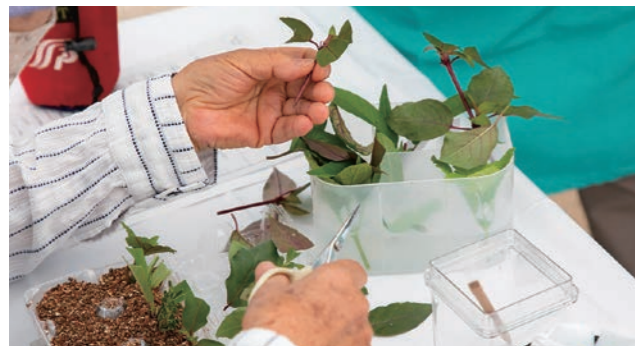
さし芽教室 指導:市民緑化ボランティア(はなパル・にしのみや)、花工房職員

フラワーフェスティバル in 西宮2023にて開催した催し物です。たくさんのご参加ありがとうございました。