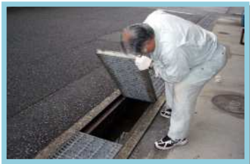
屋外の掃除には注意を！