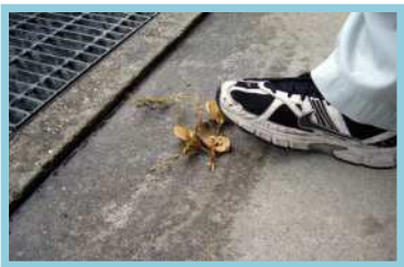
卵がある場合は踏みつぶす。