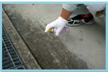
-2 殺虫剤を吹き付ける。