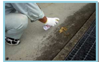
巣の周辺にも殺虫剤をまく。