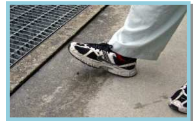
-1 見つけたクモは踏みつぶす。