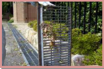
側溝・グレーチング