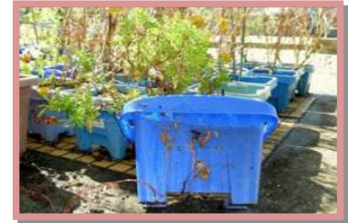
植木鉢・プランター