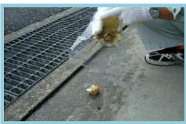
ビニール袋等に入れる。