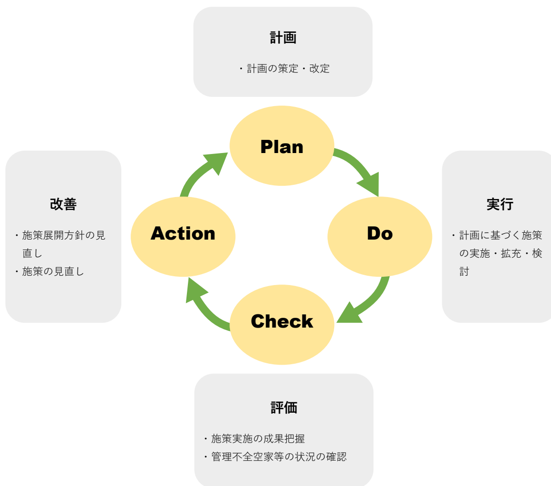
図5-3 評価、見直しの流れ

社会情勢の変化や経年変化、法改正、上位計画等の見直し、空家対策の施策や事業の進捗状況に応じて計画の適切な見直しを行います。