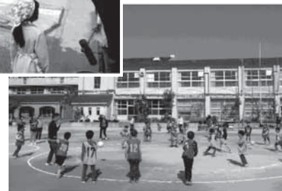
（上）甲陽園地区「もちつき体験会」