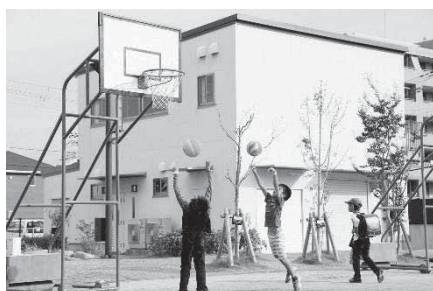
放課後キッズルーム事業の様子（高木北小学校）