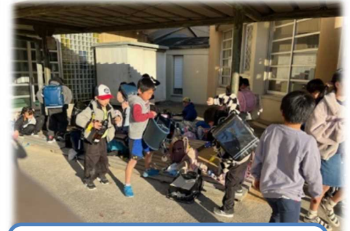
げこう まれい な 下校の予鈴が鳴ったら、受付名簿の 「さいご」に○をしてから「さようなら～」