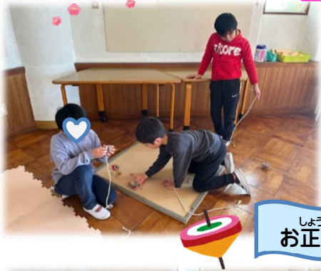
しょうがつ お正月あそび

※ひろばは全学年の授業が 終わってからはじめます。 それまではルームですご します。