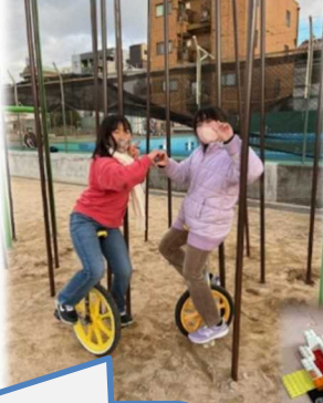
いちりんしゃ だい 一輪車は4台あります。 がんばって練習をして、きづけばスイスイ の かんじゆう 乗れるようになっている子も！すばらしい！