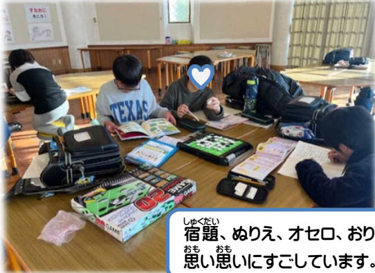
しゅくだい 宿題、ぬりえ、オセロ、おりがみ。 おも おも 思い思いにすごしています。