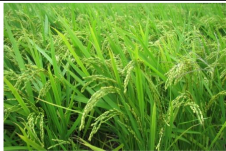
名塩地区の田んぼ

今月の地産地消の「米」・「だいこん」・「はくさい」は、山口・名塩地区で収穫されます。