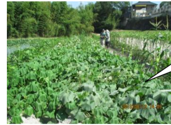
山口町金仙寺地区のかぼちゃ畑