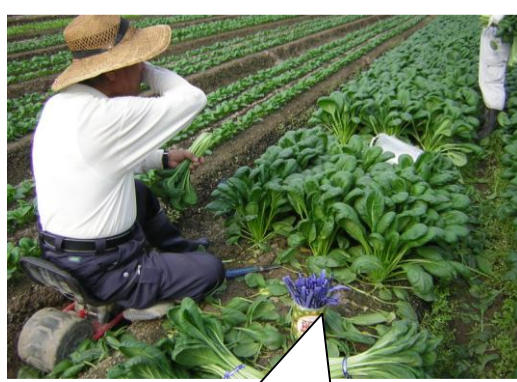
「こまつな」の収穫の様子

西宮産の「みずな」「こまつな」 「地産地消」は作物など収穫されたその土地で、消費する（食べる）ことをいいます。 今月の「つくねだんごじる」に西宮産のみずなを使用します。小学校Aブロックは16日・Bブロックは8日・中学校は30日です。 また、西宮産のこまつなは、小学校Aブロックは22日・Bブロックは18日に「こまつなとベーコンのパスタ」で、中学校は4日に「ごまあえ」で使用します。 今月の「みずな」「こまつな」は、瓦木地区・鷲林寺地区で収穫されます。