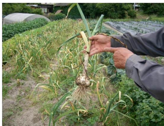
名塩地区の畑で撮影しました。

小学校Aブロックは14日(木)・Bブロックは15日(金)「ペペロンチーノ」に、中学校は12日(火)「夏野菜のカレー煮」に使います。にんにくは、10月下旬に植えて6月中旬に収穫します。下葉が2・3枚枯れてきたら収穫の時期です。虫がつきにくいので、ほとんど農薬を使わないで栽培できます。