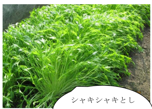
シャキシャキとした食感が特徴の「みずな」