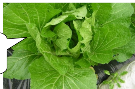
名塩地区のはくさい畑