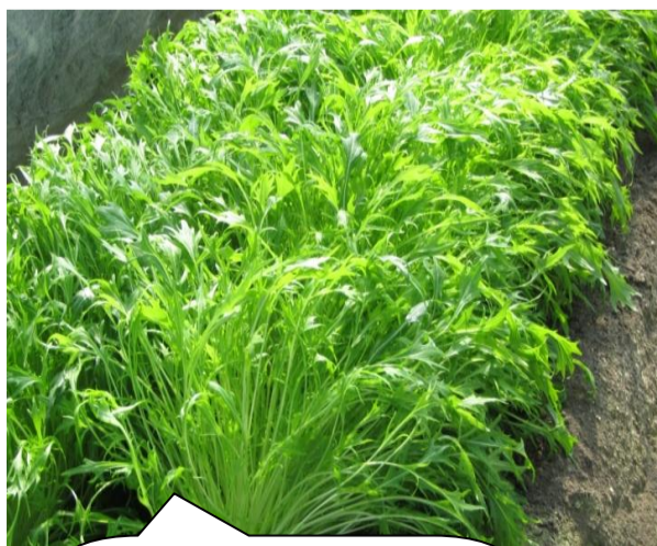
シャキシャキとした食感が特徴の「みずな」