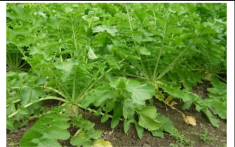
名塩地区のだいこん畑