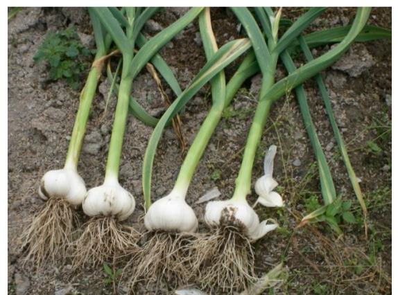
1皮むくと真っ白です。