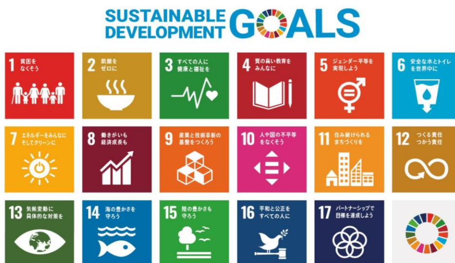
西宮市食品衛生監視指導計画とSDGsとの関係

平成27年の「国連持続可能な開発サミット」において、「持続可能な開発のための2030アジェンダ」とその17の「持続可能な開発目標（SDGs）」が採択されました。SDGs（Sustainable Development Goals）では、経済・社会・環境の3つの側面のバランスがとれた持続可能な開発に際して、複数目標の統合的な解決を図ることが掲げられています。本計画においては、市民、事業者、行政がそれぞれの役割を認識し、相互に連携・協働しながら取組みを進めることにより、特に以下に挙げるSDGsの3つの目標達成に寄与することが期待されています。