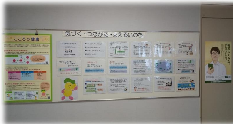
令和 5 年度の会場の様子