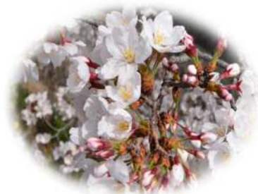
西宮市の市花 さくら