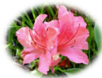
芦屋市の市花 コバノミツバツツジ