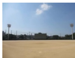
多目的グラウンド