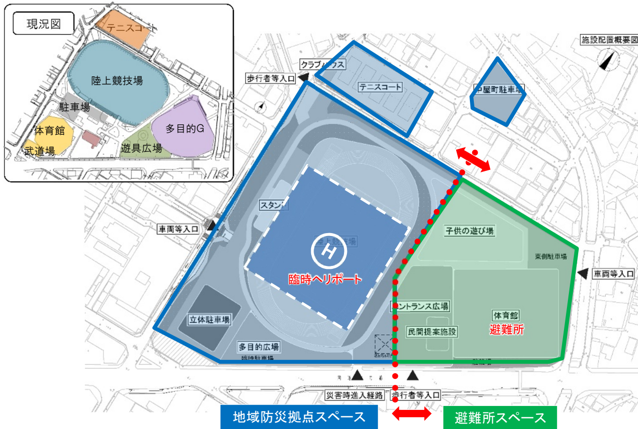
【地域防災拠点・避難所の活用イメージ】