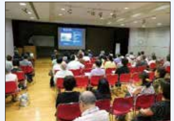
インターカレッジ西宮

大学交流センターでは、市内大学・短期大学の教員が講師となり、様々なテーマで講義を行い、市民の皆さまに受講していただく講座を開講しています。