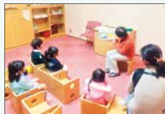
ボランティアによるおはなし会

絵本の読み聞かせや視覚に障害がある方への対面朗読、本の修理など、様々な活動で市民の皆さまの読書や学びを支えています。