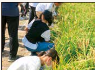
稲刈りの様子(鳴尾北小学校)

地域住民が学校運営に参画し、地域と学校が協働して、登下校の見守りや昔遊び、園芸ボランティアなど、様々な活動を進めています。