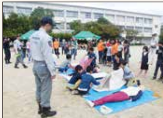
小学校区防災訓練

自主防災会を中心に、自治会や様々な地域団体、児童が参加し、一体となって防災訓練を実施することで、地域防災力の向上を目指します。