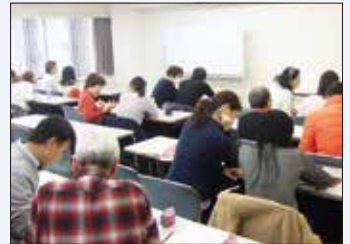
外国人のための日本語レッスン

日本語教室だけでなく、支援が必要な外国人市民へのサポートやボランティア活動など多文化共生の取り組みを行っています。