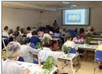
選択コース「園芸」講座

60歳以上の市民を対象に、健康で生きがいのある生活をつくるための学習と交流の場です。また、自主グループ活動も活発に行われています。