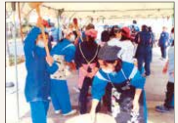
ふれあいお餅つき大会

青少年愛護協議会や子ども会、コミュニティ協会など、地域の方々の参画を得て、地域活動の場や家族とのふれあいの機会を提供します。