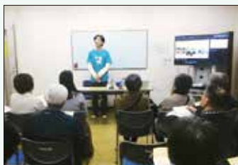
講師プレゼンテーション会

ご自身の知識・技術や学習成果を活かして、公民館地域学習推進委員会が企画する講座の講師をしてみませんか。