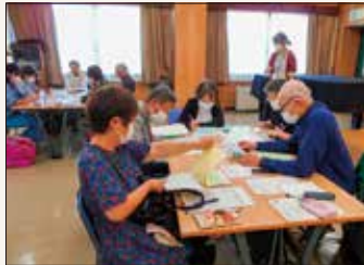
公民館地域学習推進員研修会

地域にお住まいの方が、地域学習推進員となって、様々な講座を企画・開催しています。