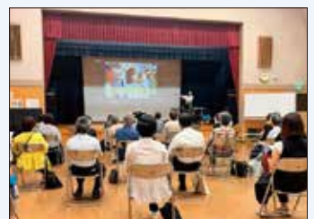
「ウクライナの現地の声～戦火の女性や子どもたち～」

同和問題をはじめ、子供、女性、高齢者、障害のある人、性的少数者など、さまざまなテーマをとりあげて開催しています。