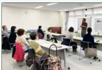
福祉ボランティア入門講座

広く入門向けとテーマ型のボランティア講座の開催や、ボランティア活動の機会をつくり、人材の発掘・育成を行っています。