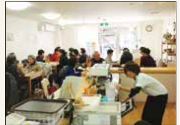
共生型地域交流拠点 まちCafeなごみ(鳴尾東地区)

地域に住む様々な人が分野・世代を問わず、気軽に集える場所です。運営される方の想いのもと、それぞれ特色を活かして活動を行っています。