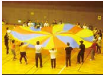
西宮青年生活学級 「『からだを動かそう』パラバルーンをみんなで一緒に♪」

西宮青年生活学級(18歳以上の知的障害者を対象に開催)では、レクリエーション活動を通して、さまざまな生活体験をしながら学習をしています。