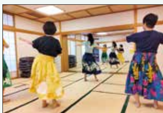
公民館活用促進プロジェクト (フラダンス講座)