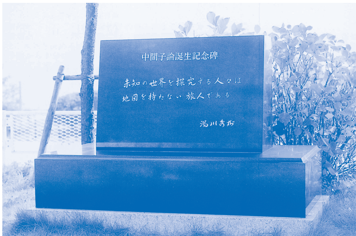
中間子論誕生記念碑(西宮市立苦楽園小学校 校庭)