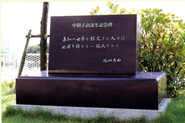
苦楽園小学校校庭に建立された「中間子論誕生記念碑」