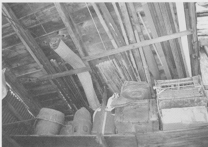
鳩小屋下（大上報文参照）