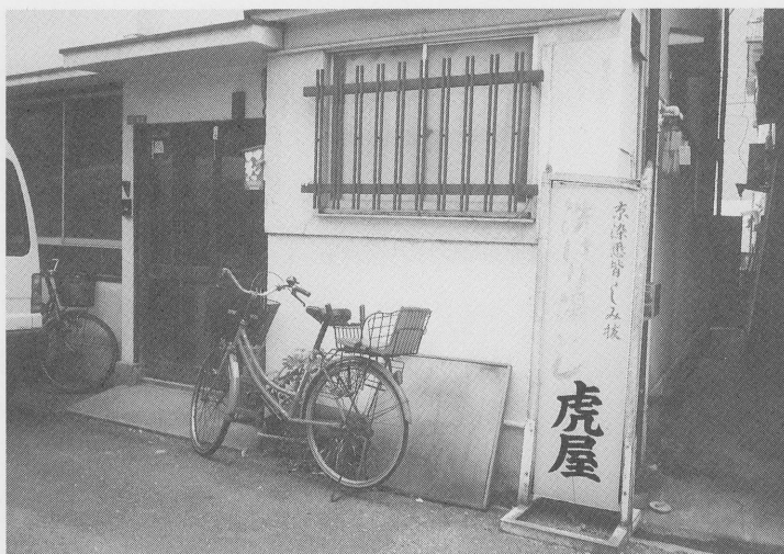
虎屋の店先（大上報文参照）

西宮市立郷土資料館 兵庫県西宮市川添町15番26号 〒662-0944 電話 0798-33-1298 email nmc00065@nishi.or.jp web www.nishi.or.jp/~kyodo/