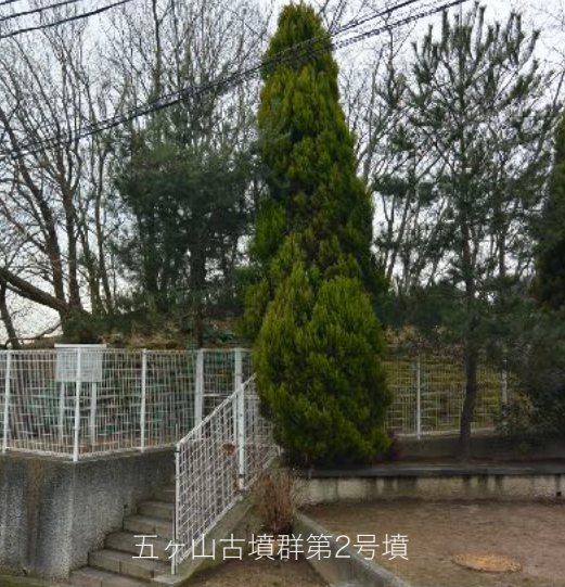
五ヶ山古墳群第2号墳