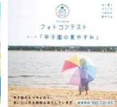
情報発信事業 Instagramフォトコンテスト告知画像