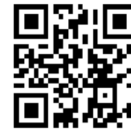
甲子園スタイル ホームページ