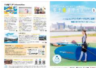
情報発信事業 エリア情報誌「甲子園スタイルガイド」