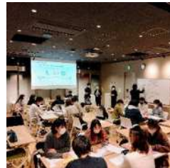
プラットフォーム事業 西宮スポーツアカデミーグループワークの様子