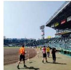
賑わい創出事業 甲子園エンジョイラン