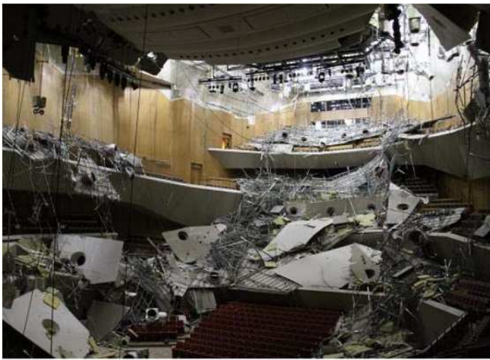
(参考) 一般社団法人建築性能基準推進協会発行 「天井の耐震改修のススメ」