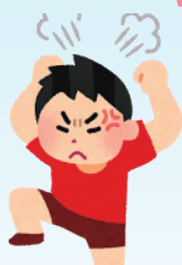
イライラしている